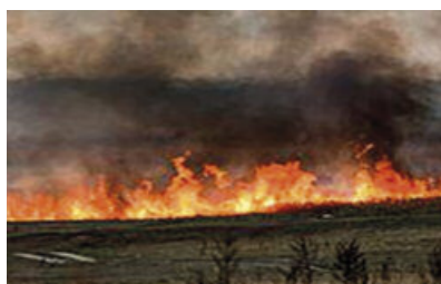
Wypalanie traw jest szkodliwe, zabronione i grożą za to kary str. 6