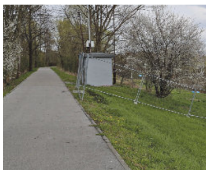
Kolejny etap budowy trasy rowerowej str. 5