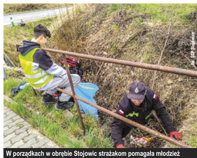
W porządkach w obrębie Stojowic strażakom pomagała młodzież

Z końcem marca jednostka OSP Stojowice przeprowadziła akcję zbierania śmieci, w czym otrzymała wsparcie od młodzieży. Zebrani w dwóch grupach przemierzali niemal całą miejscowość, w efekcie czego przygotowano liczne worki gotowe do odebrania przez służby komunalne. Podobną akcję przeprowadzono również w Nowej Wsi.