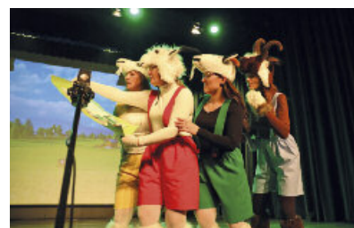
Spektakl „Koziołek na Królewsczyźnie” zachwyć publiczność! str. 11