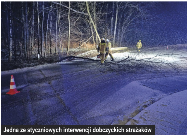
Jedna ze styczniowych interwencji dobzczyckich strażaków

Według statystyk publikowanych przez PSP Myślenice, w minionym roku jednostka OSP Dobczyce należała do pierwszej trójki jednostek KSRG najczęściej interweniujących (oprócz Pcimia i Sułkowic) w naszym powiecie. Styczeń już rozpoczęła aktywnie, wyjeżdżając m.in. na ul. Dębową do pożaru sady w kominie, do wypadków na ul. Jagiellońskiej i Kościuszki i do usunięcia pochyłonego nad jezdnią drzewa na ul. Przemysłowej.