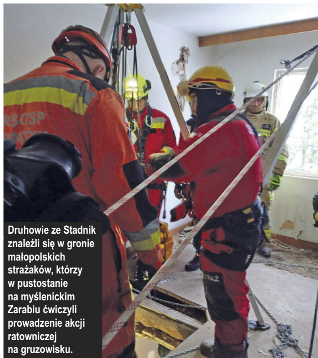
Druhowie ze Stadnik znaleźli się w gronie małopolskich strażaków, którzy w pustostanie na myślenickim Zarzbiu ćwiczyli prowadzenie akcji ratowniczej na gruzowisku.