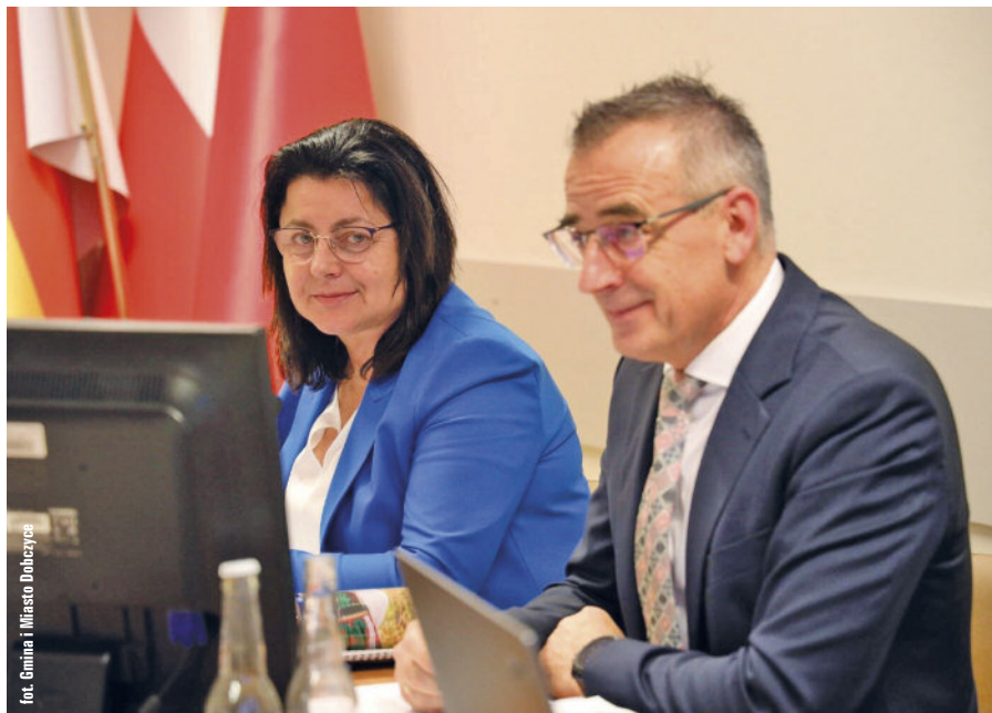
fol. Gmina i Miasto Dobczyce

I etap odbudowy ruin zamku w Dobczycach, konserwacja figur oraz schodów prowadzących na Stare Miasto, a także dotacja na konserwację zabytkowej dzwonnicy przy kościele w Dziekanowicach to zaplanowane na 2025 r. zadania z zakresu kultury i ochrony dziedzictwa narodowego.